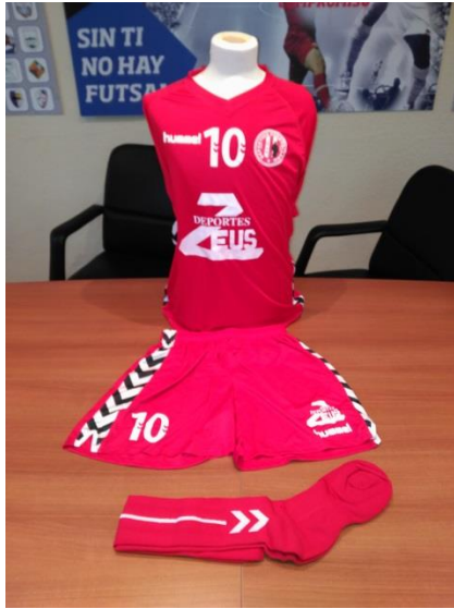
MODELO N° 1